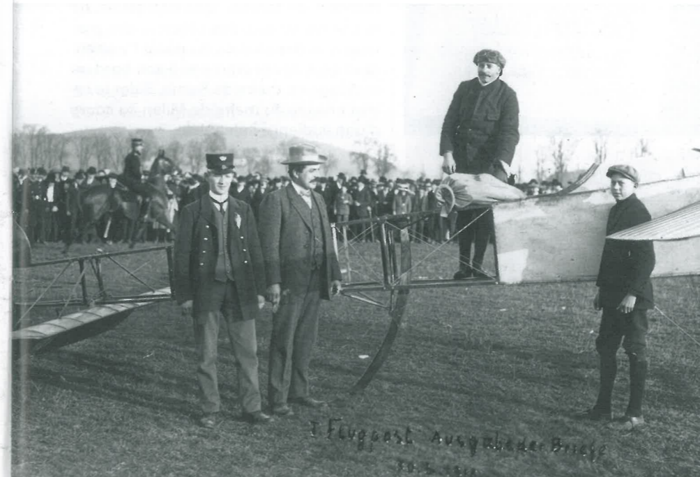
Bider transportiert Luftpost von Bern nach Burgdorf.

Le 13 juillet 1913, Oskar Bider s'envole vers Milan pour son légendaire survol des Alpes.