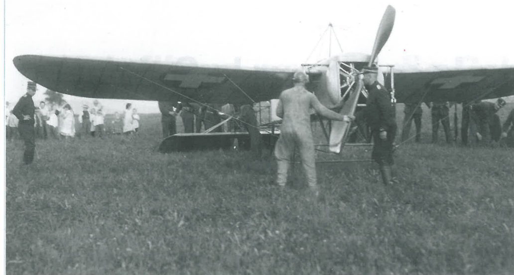
Oskar Bider bei einem Startversuch auf dem Berner Beundenfeld am Vortag der Alpenüberquerung.

Oskar Bider lors d'un essai de décollage sur le Beundenfeld de Berne, la veille de la traversée des Alpes.