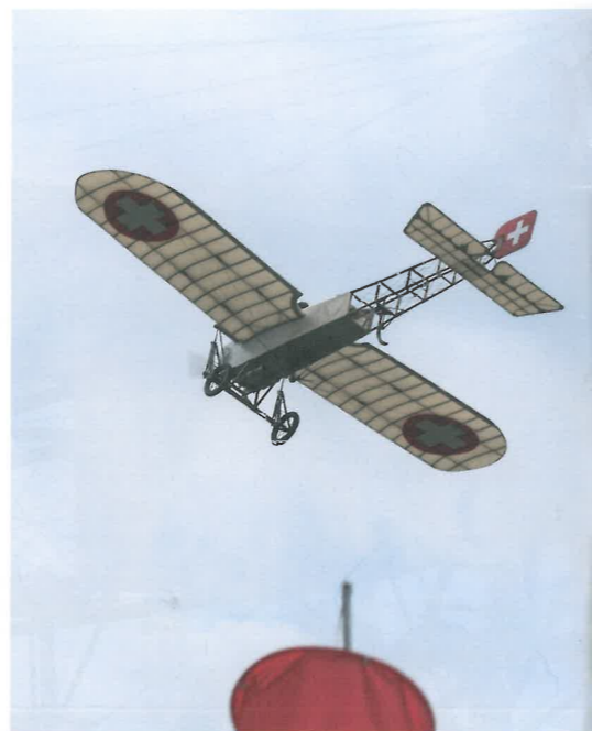
Départ à la conquête des Alpes, comme il y a 100 ans. Start zur Eroberung der Alpen, wie vor 100 Jahren.